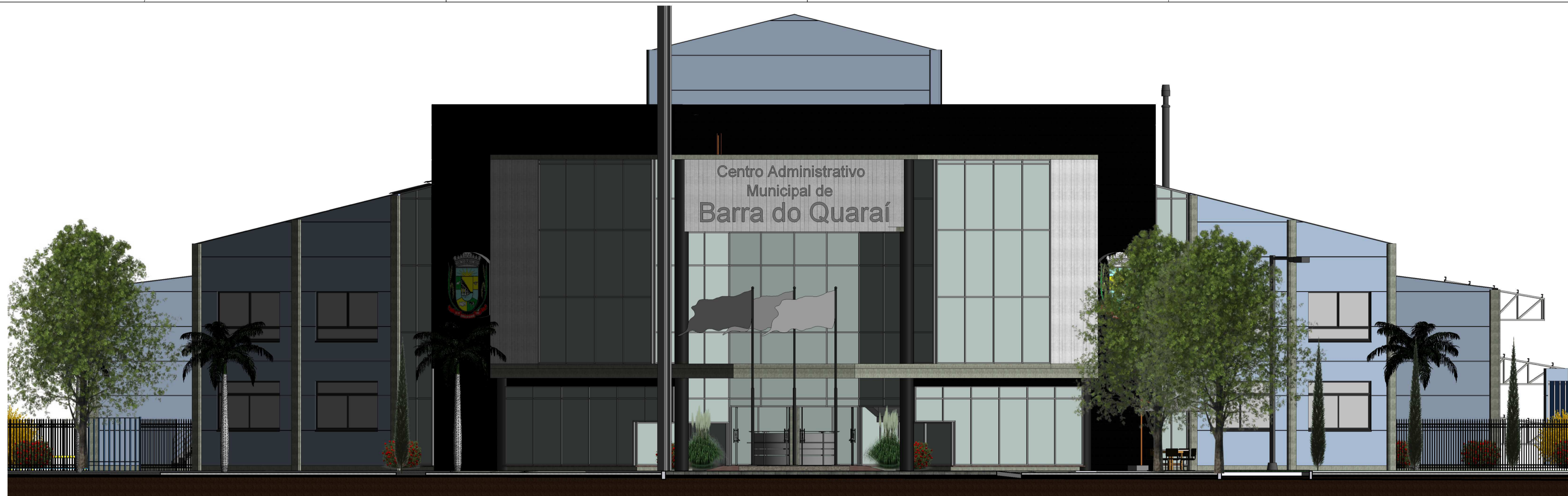
1 Oes-noroeste 1 : 100